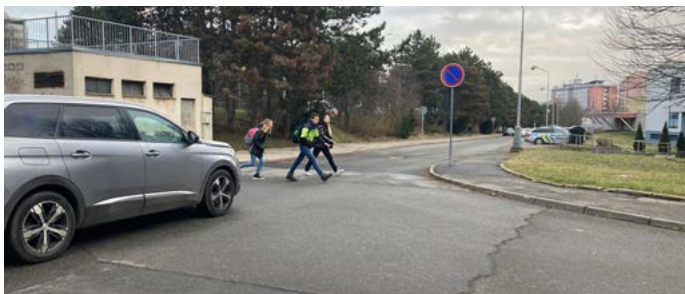
Mirek Žbánek primátor

Jaké záměry má město s prostranstvím před vysokoškolskými kolejemi ve Šmeralově ulici? Předpokládám, že zpevněná plocha, na které je teď stavební materiál a suť, bude obnovena jako hřiště. Ale co ta travnatá část, kde se jen scházejí bezdomovci. Nebylo by možné z ní udělat psí louku?