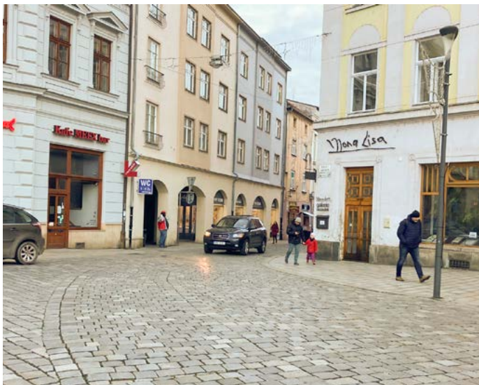
Mírek Žbánek primátor

Další černá skládka na Družební ulici. Nebylo by lepší zrušit tyto kontejnery, které jsou zneužívány?