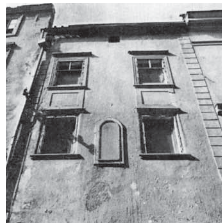
Detail fasády průčelí 1. a 2. patra. Stav před rekonstrukcí v roce 1985.

domu. Ve středověkých měšťanských domech bývaly jedna až dvě síně, a to v přízemí a patře domu, situované nad sebou. Přízemní vstupní prostor, klenutý, měl komunikační a provozní funkci. Vcházelo se tam z ulice. Majitel domu buď tam, anebo v zadní komoře, provozoval řemeslo, obchod anebo se tam čepovalo pivo, pokud se jednalo o právovárečný dům. Ve střední části býval umístěn vstup do sklepa. Po schodech se vcházelo do malého prostoru patra (sínce), odkud vedl vstup do patrových místností zadní komory, černé kuchyně ve střední části traktu a do takzvané přední „svrchní síně“. Tato síň, s okny orientovanými do průčelí, sloužila jako shromažďovací místnost rodiny. Zahrnovala buď celý plošný prostor přední části patra domu, anebo byla, jako v našem případě, tato prostora rozdělena na dvě nestejně velké části. V zadním traktu byla umístěna