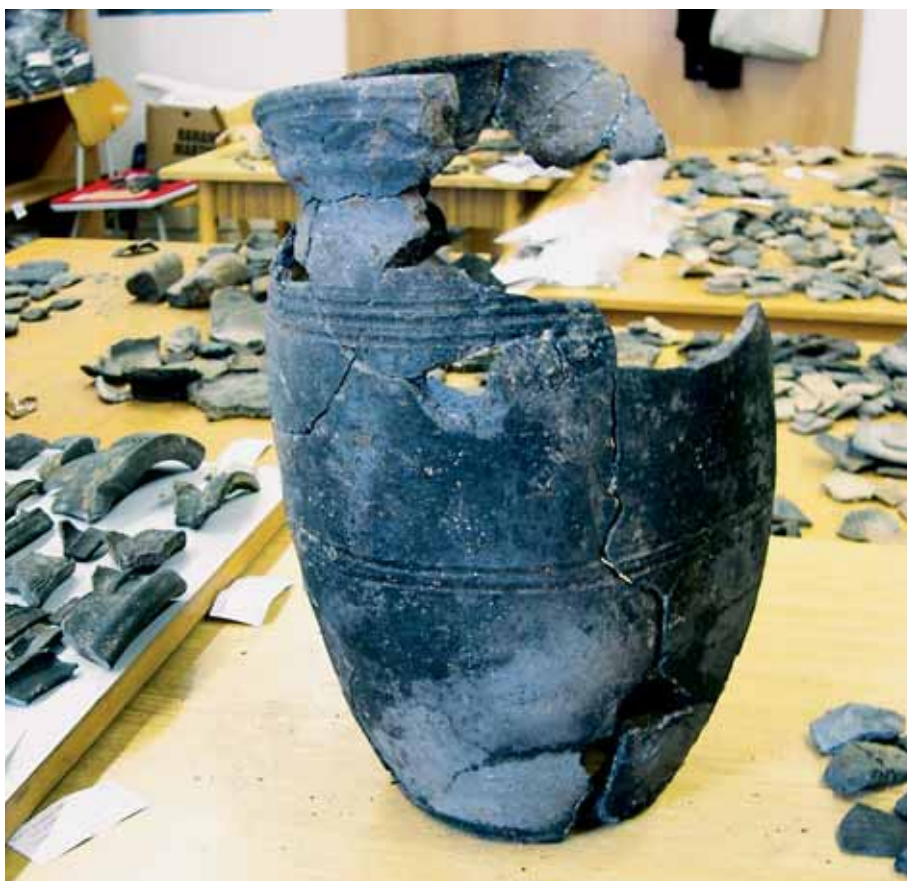
Sestavit z desítek střepů původní nádobu je opravdu pracné.