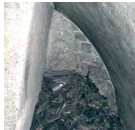
Západní kamenná stěna románské krypty v Dietrichštejnské hrobce (fotografie ze sondy).