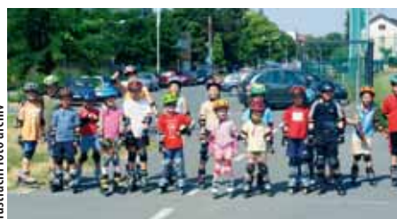
Ilustrační foto archiv

■ V polovině července začala na dopravním hřišti v areálu Sigmy Olomouc In-line školka, která je součástí příměstských táborů a bude probíhat po celé letní prázdniny. Děti se zde zdokonalují v in-line bruslení za dohledu instruktorů akreditovaných Ministerstvem školství, mládeže a tělovýchovy ČR. Zahájení se 13. července zúčastnili policisté z preventivně informační skupiny, kteří dětem připomenuli povinnosti týkající se pohybu na pozemních komunikacích, cyklo a in-line stezkách. (red)