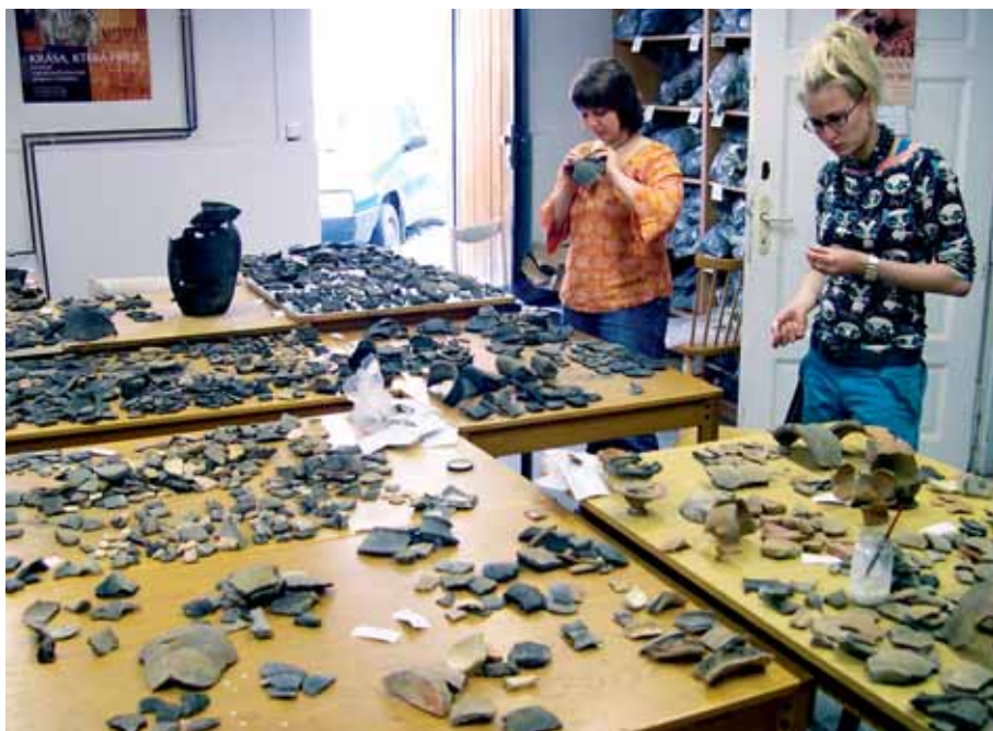
Studenti třídí nálezy keramických střepů.