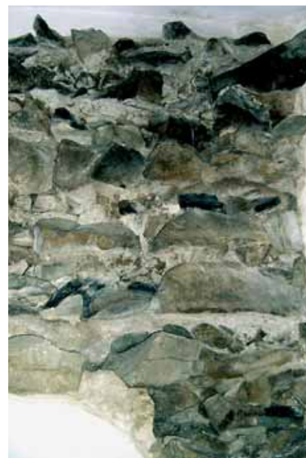
Základy neznámého kostela ze 12. století ve Wurmově ulici.

Kdo knížecí hrad na Dómském vršku založil, je jedna otázka, druhá pak je, jak se vlastně stavebně vyvíjel. Opakované funkční proměny areálu (ze sídla knížat