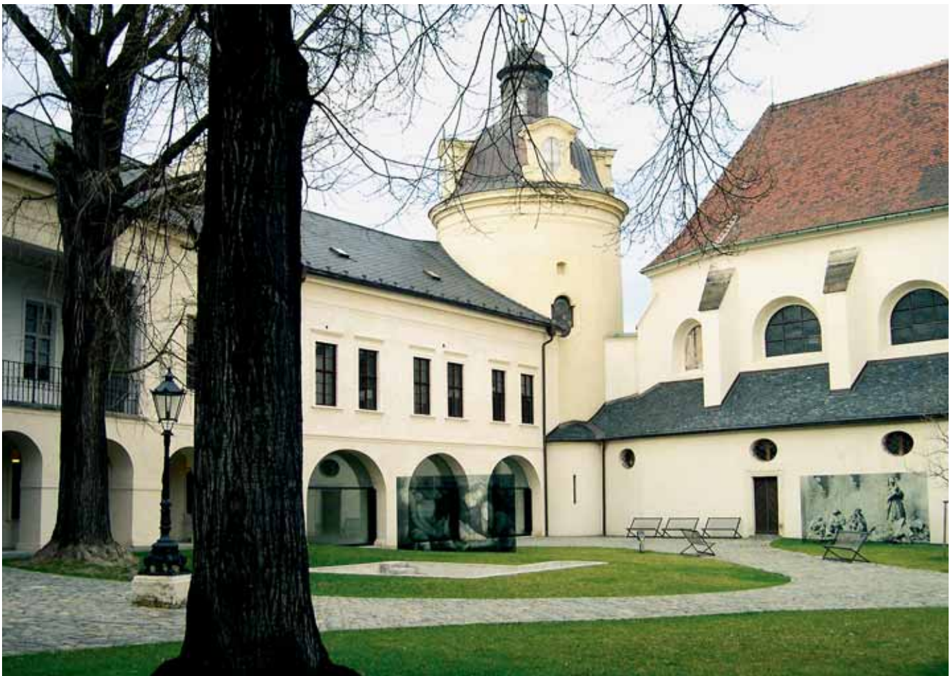
Válcovitá kaple svaté Barbory bývala ve středověku věží hradu. Pochází z doby kolem roku 1200 a měla by být nejstarší takovou věží na našem území.

Český Achilles je přízvisko, které provází dějinami knížete Břetislava. Ano, právě toho, který podle pověsti unesl ze svinibrodského kláštera svou nevěstu, markraběcí dceru Jitku. A tento Břetislav stojí možná u počátků olomouckého knížecího hradu. I když, ani sami historici se zatím neshodují, zda stál knížecí palác nejdříve na protějším, Petrském návrší, a na Dómské návrší se přestěhoval až koncem 11. století, nebo zda se zde hrad budoval už za knížete