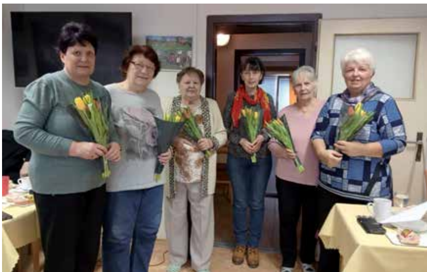
9 Klub z Fischerovy ulice slavil 16. narozeniny