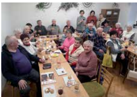
10 Senioři z Droždína si setkání umějí užít