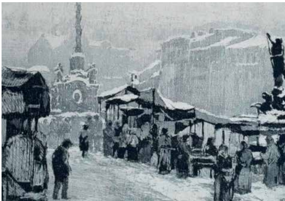
Trhovci na zasneženém Dolním náměstí

po vzniku Československa připravil soubor s názvem Album českého Olomouce. Vydal společně s olomouckým deníkem a nakladatelstvím Pozor reprezentativní soubor více než pěti desítek pohlednic moravských měst, mezi nimiž nemohl chybět tradiční motiv z olomouckého Horního náměstí.