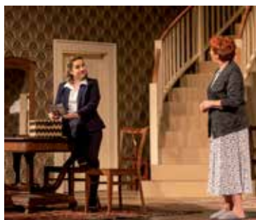
14 Do divadla na tragikomedii Michala Sýkory