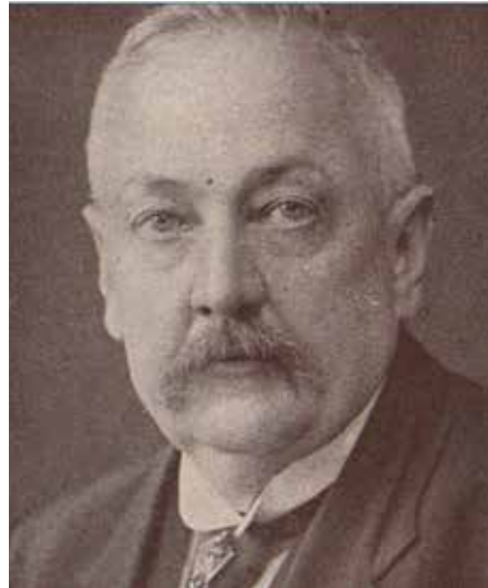
Malíř Karel Wellner

Pokud byste chtěli vidět, jakým dojmem a atmosférou působilo město Olomouc před sto lety, najdete si některé z vyobrazení města od profesora Wellnera. Olomouc mu vděčí za stovky zpodobnění ve formě akvarelů, leptů, rytin, olejomalb, kvašů a dalších technik. Jeho ztvárnění známých míst a památek, jako je radnice, sloup Nejsvětější Trojice či některé kašny, stejně jako méně známých, ale velmi působivých a romantických zákoutí a starých uliček, patří k nejkrásnějším