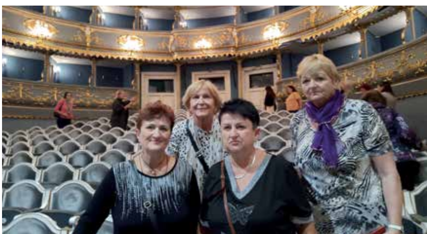
19 Fotoalbum ze života olomouckých klubů