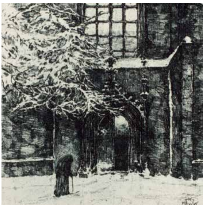
Chrám svatého Mořice