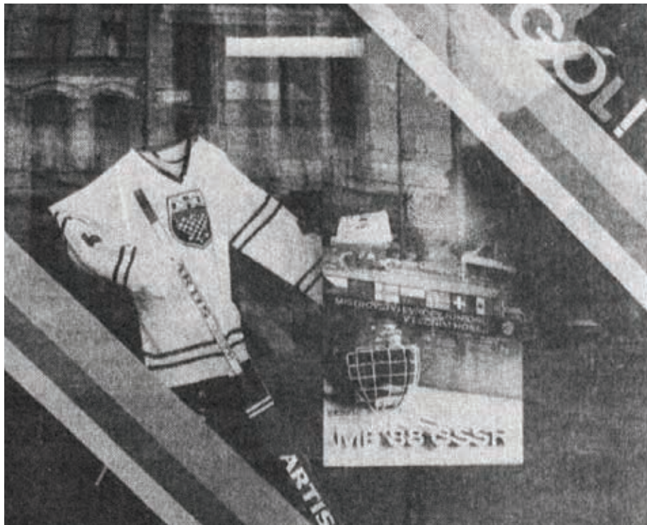
Výloha v Palackého ulici s dresy.

Kromě zmíněného hokejového šampionátu juniorů s mnoha hvězdami světového hokeje hala zažila oslavy titulu mistrů extraligy v roce 1994 a byla také domovským ledem pro nejúspěšnější reprezentanty v historii československého krasobruslení, taneční