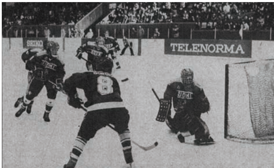
Z posledního utkání ME juniorů v hokeji na olomouckém ledě. Finové v něm porazili sovětské reprezentanty 3:2.