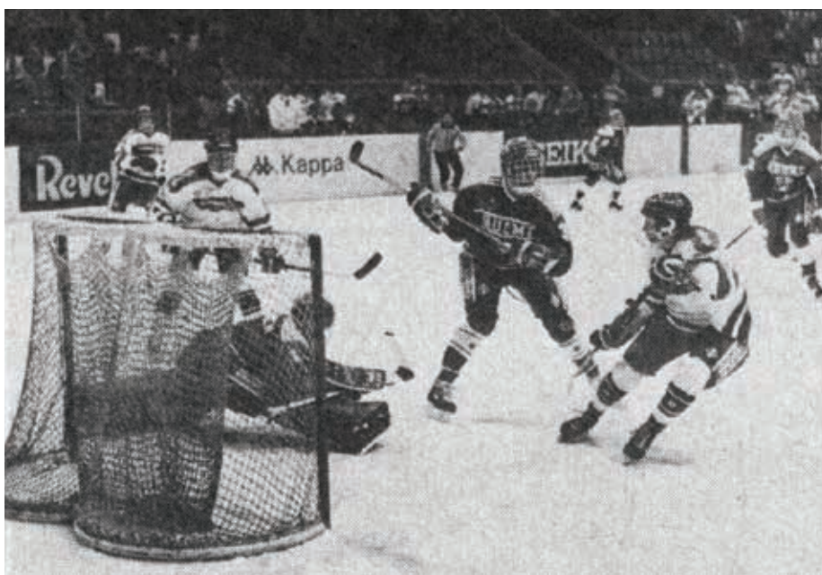
Finsko – Švýcarsko.

Sovětská sborná do Olomouce přivezla přinejmenším dvě budoucí hvězdy světových parametrů, a to obránce Sergeje Zubova a útočníka Pavla Bureho, oba s velikým počtem startů v NHL.