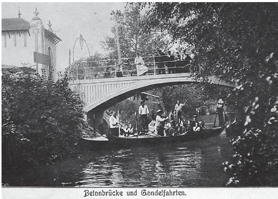
Betonbrücke und Gondelfahrten.

První velikou výstavu olomoucká komora uspořádala v roce 1892. Místo bylo tehdy jasně dané – areál měšťanské střelnice, tedy tam, kde je dnes malý parčík a okolí ulice Na Střelnici, fotbalový a te-