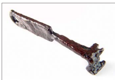
Kovový římský klíč, nález z neřídinského legionářského tábora

říše, podporovaly i občasné nálezy římských mincí. Legenda se objevovala ve chvalozpěvech na Olo-