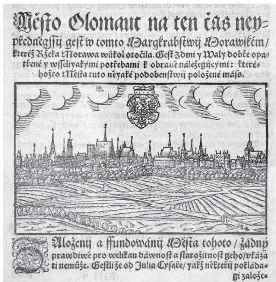
O možném římském původu města Olomouce píše v roce 1593 Bartoloměj Paprocký z Hlahol

Humanisté se rekrutovali především z lidí v blízkosti biskupského dvora, potažmo šlo přímo o olomoucké biskupy. Jedním z nich byl Stanislav Thurzo, který funkci biskupa zastával v letech 1497–1540. Humanisticky orientovaný biskup proslul jako organizátor a příznivec olomoucké učené společnosti Sodalitas Maierhofiana, založené roku 1502. Členy učené společnosti se později stali i další olomoučtí biskupové Jan Dubravius a Marek Kuen. A právě mezi těmito vzdělanci se těšila veliké přízni ona legenda o římském založení města. Představu o tom, že Olomouc se zrodila už za velké římské