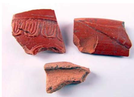
Římská keramika, nalezená v Neredíně

probíhá trh, že tedy žádné nebezpečí nehrozí. I poručil Caesar vyjet na nejvyšší ze tří návrší, které se ze všech stran prudce svažovalo do okolní roviny. Odtud se mu naskytl krásný pohled na celé rovinaté okolí na severu lemované kopci. Všude převládaly lužní lesy, mezi nimiž se krčily malé kousky vyklučené