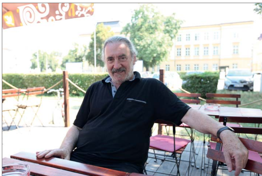
Izraelský historik vedl projekt dokumentace vzpomínek nežidovských pamětníků holokaustu.

médiem. Samozřejmě, psané slovo v literárním smyslu má velkou moc, ale dnes knihy čte jen málo lidí. Když můžeme studentům při výuce pustit záznamy rozhovorů s pamětníky holokaustu, je to velmi přesvědčivé a bezprostřední.