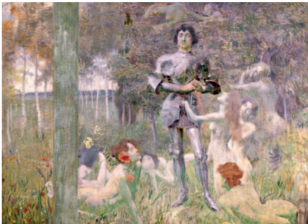
Jan Preisler, Cyklus o dobrodružném rytíři, 1897–1898.

Součástí instituce je Arcidiecézní muzeum Olomouc, expozice evropského významu, jediná svého druhu v ČR pro duchovní výtvarnou kulturu 12. až 18. století. Sídli v rekonstruované národní kulturní památce Přemyslovský hrad, v areálu, který je dokladem tisíciletí stavebního vývoje a patří k nejstarším trvale osídleným lokalitám střední Evropy. V r. 1306 zde byl zavražděn poslední český král z rodu Přemyslovců Václav III. Stálá expozice Arcidiecézní muzea Olomouc nazvaná Ke slávě