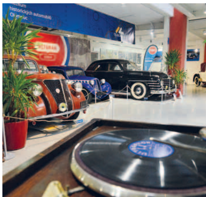
Jak stará auta, tak historické gramofony a rádia mají nezaměnitelné kouzlo.

„Veteran Arena úžasným způsobem rozšířila rodinu olomouckých muzeí. Vystavené exponáty určitě nadchnou každého, protože jsou prostě krásné,“ komentuje expozici