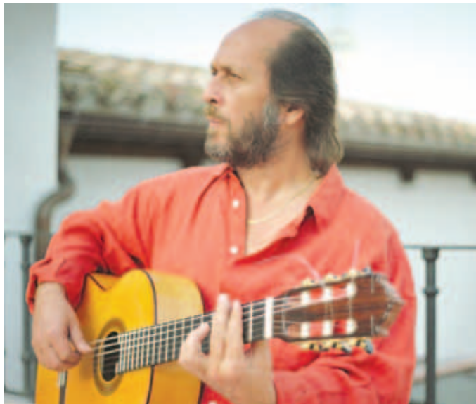
Paco de Lucía je nejlepším světovým kytaristou ve stylu flamenco.

COLORES FLAMENCOS OLOMOUC | 25.–28. 7. Koncert PACO DE LUCÍA | 26. 7. | Horní náměstí Olomouc www.flamencool.cz