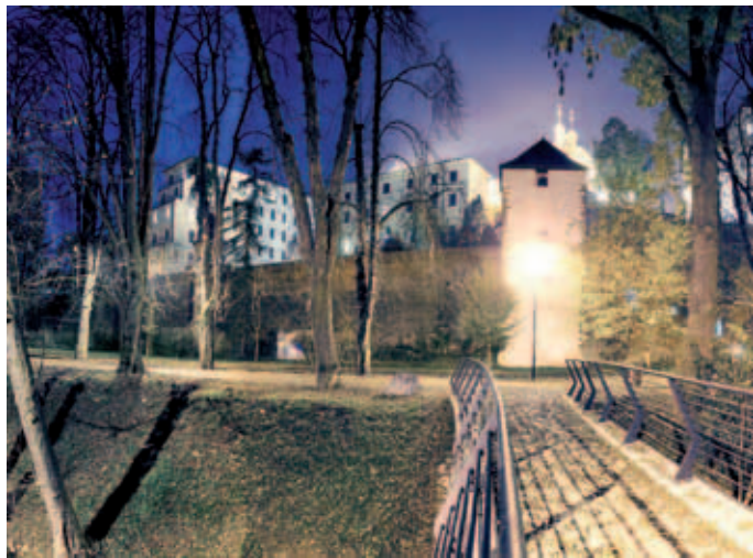
Hradby obklopují velkou část historického centra města.

Květen, červen, září, říjen – sobota a neděle od 11 do 17 hodin Červenec a srpen – středa až neděle, od 11 do 17 hodin Tel.: 777 135 001, www.pevnost-radikov.cz