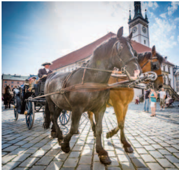
Ke Svátkům města Olomouc patří i průvod ke cti svaté Pavliny.