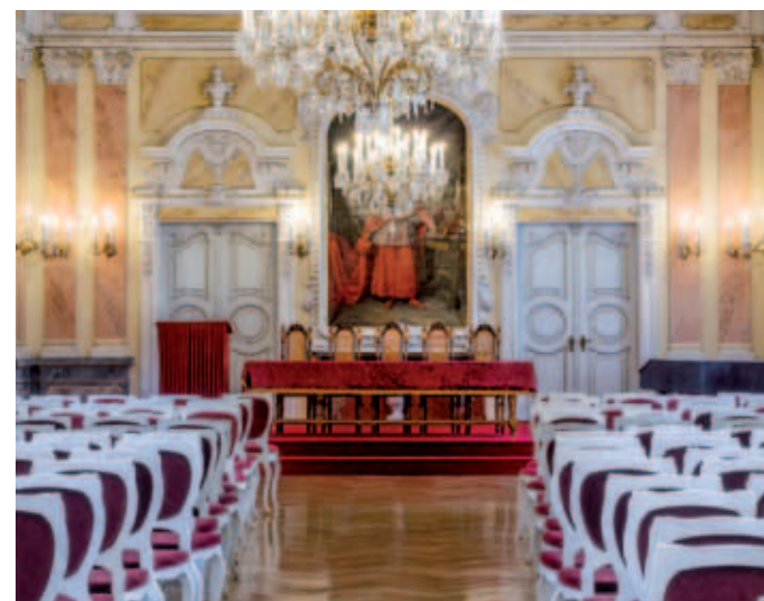
Jeden ze slavnostních sálů Arcibiskupského paláce v Olomouci.

Noční prohlídky sálů Arcibiskupského paláce pátek, 24. 5. 2013 | 17:00 – 24:00. Poslední prohlídka ve 23:30