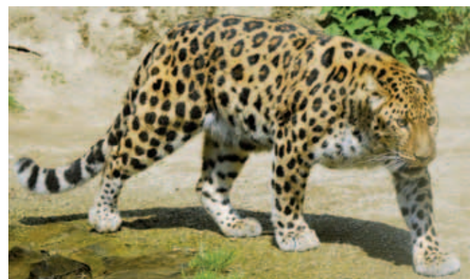
Levharti získají v zoo supermoderní pavilon.

Olomoucká zoologická zahrada je mimo to atraktivní velkým množstvím chovaných druhů (cca 350) a počtem zvířat (přes 1700 kusů). Lidé zde rádi navštěvují pavilon s překrásnými