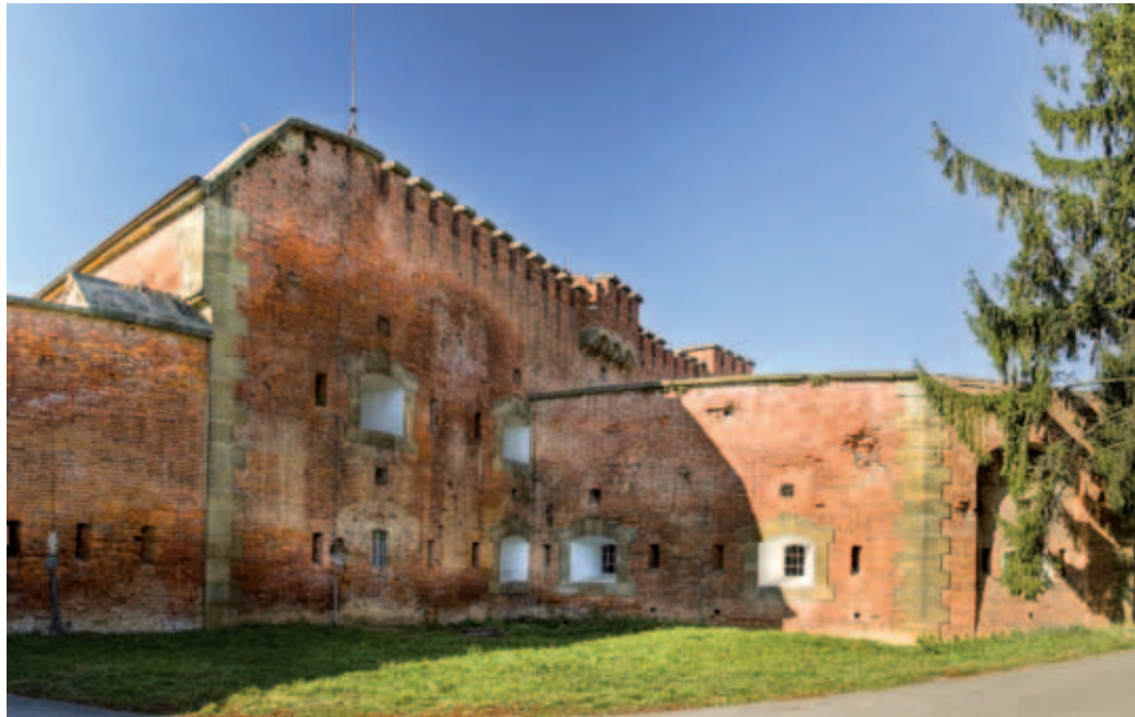
Součást věnce fortů na obvodu Olomouce.

V posledních letech si lidé zvykli chodit do Korun-