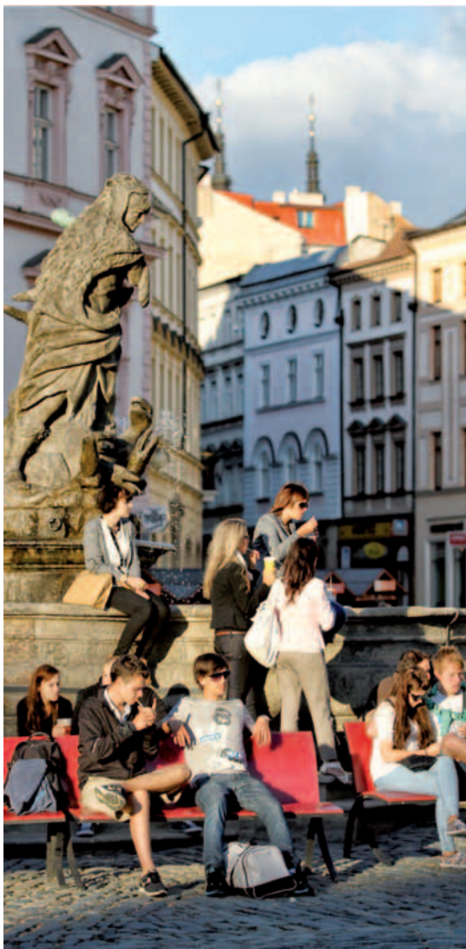
Život mezi památkami je v Olomouci příjemný.

V letošním roce poskytlo statutární město Olomouc v grantové politice příspěvek na Olomoucké barokní slavnosti, které se budou v Olomouci konat od 8. do 19. července. Vedle kulturního zážitku, poslechu barokní opery, bude pro zájemce přichystaná i večerní prohlídka kaple svatého Jana Sarkandera a výstup na věž kostela svatého Michala. Plánujeme