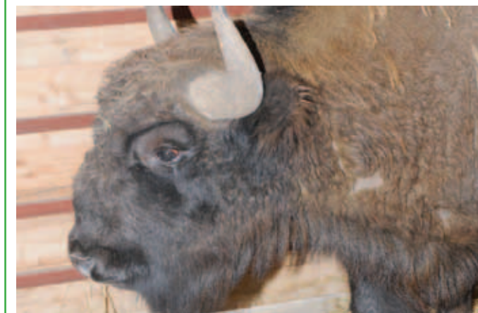
Zubr je jednou z hvězd euroasijského safari.

Tak blízko ke zvířatům, jak jen to jde. Takové by mohlo být motto, kterým se řídí Zoologická zahrada Olomouc při stavbě nových částí areálu. Letošní návštěvníci jedné z největších českých a moravských zahrad mohou vidět zblízka v unikátním prostředí levharty mandžuské, krásné velké kočky, které jsou bohužel v přírodě na pokraji vyhuby. V Olomouci se jim však daří a chovatelé se mohli v posledních letech opakovaně radovat z narození nových mláďat. Další super atraktivní novinkou bude euroasijské safari, kde zblízka, ovšem z vláčku, uvidí návštěvník třeba losy a zubry, tedy mohutné sudokopytníky, kteří kdysi dávno před staletími obývali i naše lesy. „Obě tyto nové atraktivní části zoo bychom