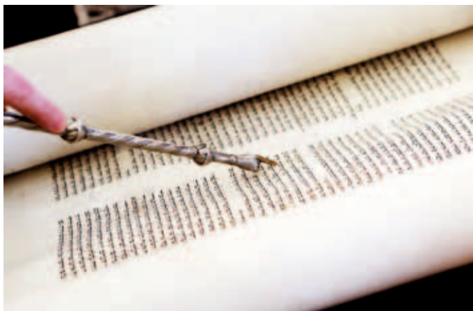
Židovská obec Olomouc, tel/fax: 585 223 119, 608 318 874, e-mail: kehila@kehila-olomouc.cz , www.kehila-olomouc.cz