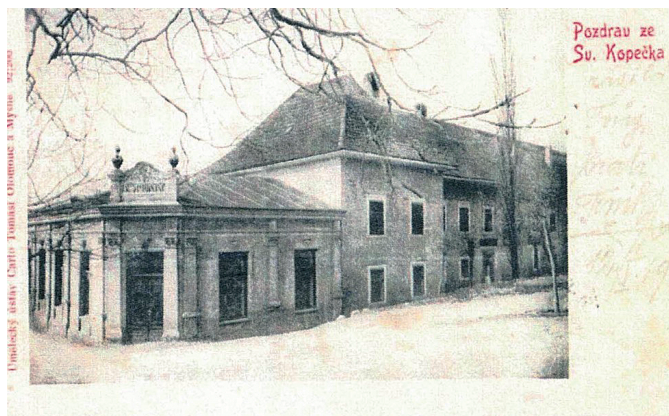
Hospic budova.