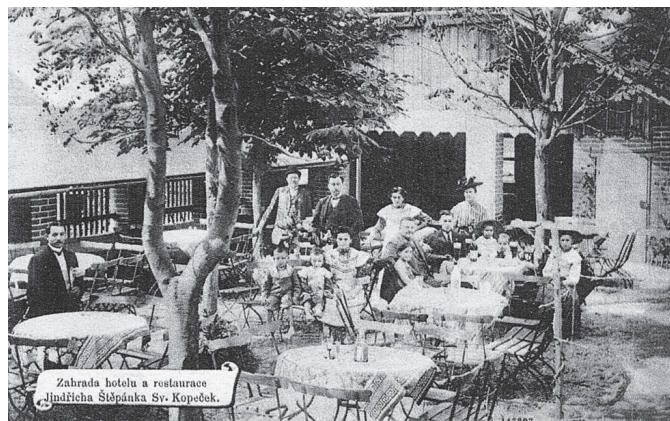
Hospic zahrada.

členů byl chátrající dům postupně opraven (krytina, okapové žlaby, kanalizace, sociální zařízení).“