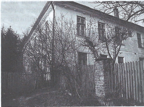
Bývalý sirotčinec sester premonstrátek ve Vésce.