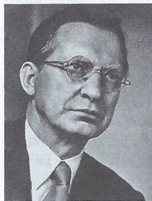
Dr. Alcide De Gasperi.