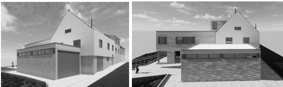
Pohled z ulice Náprstkovy a odspodu od kapličky. Stará garáž by měla zůstat, nová větší pak být přistavěna.

KMČ pozorně sleduje vývoj zpracování projektu i možností financování stavby, stavební povolení by mělo být vydáno v r.2025, ale zda se obnova dostane do plánu investic zatím nikdo neví. Náklady rostou s inflací i s nároky na vybavenost objektu, tak nezbývá než doufat a pravidelně se zastupitelům i radě města připomínat.