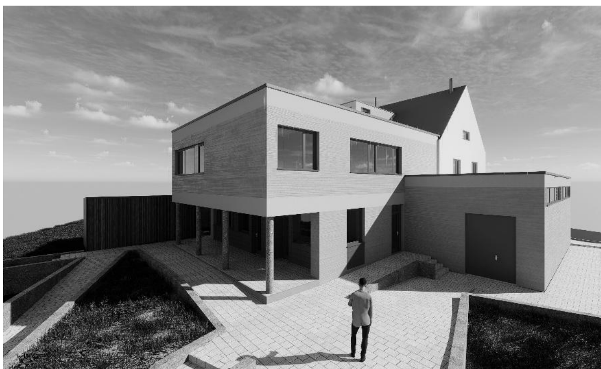
Pohled na dostavbu od nároží prodejny s pingpongovým stolem. Vizualizace projektu od firmy KANIA a.s.