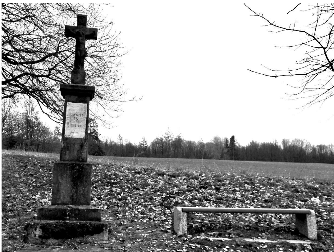
Přemístěná lavička u křížku na úvozové cestě k Posluchovu jako první z letošních plánů KMČ.