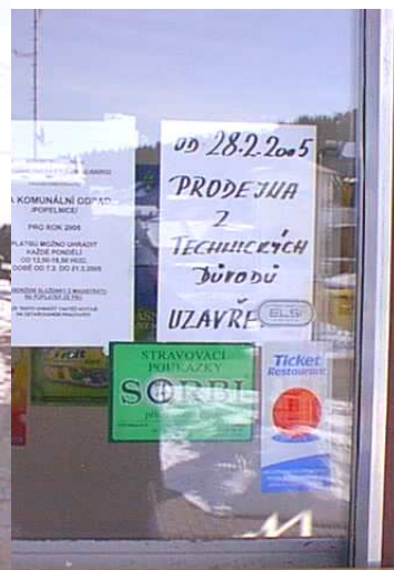
Takto nám provozovatel oznámil uzavření prodejny