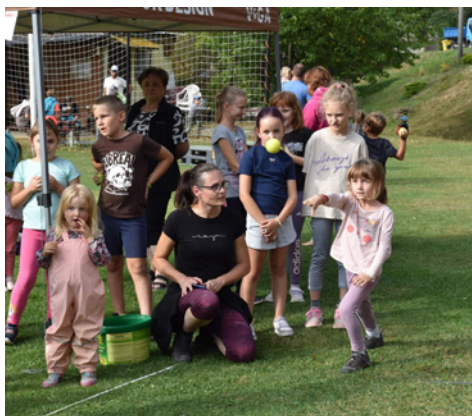
Ahoj léto, ahoj prázdniny! 6. 9. 2025