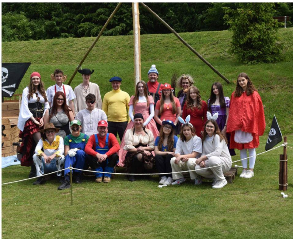
Pohádková cesta Lošov. 24. 5. 2025