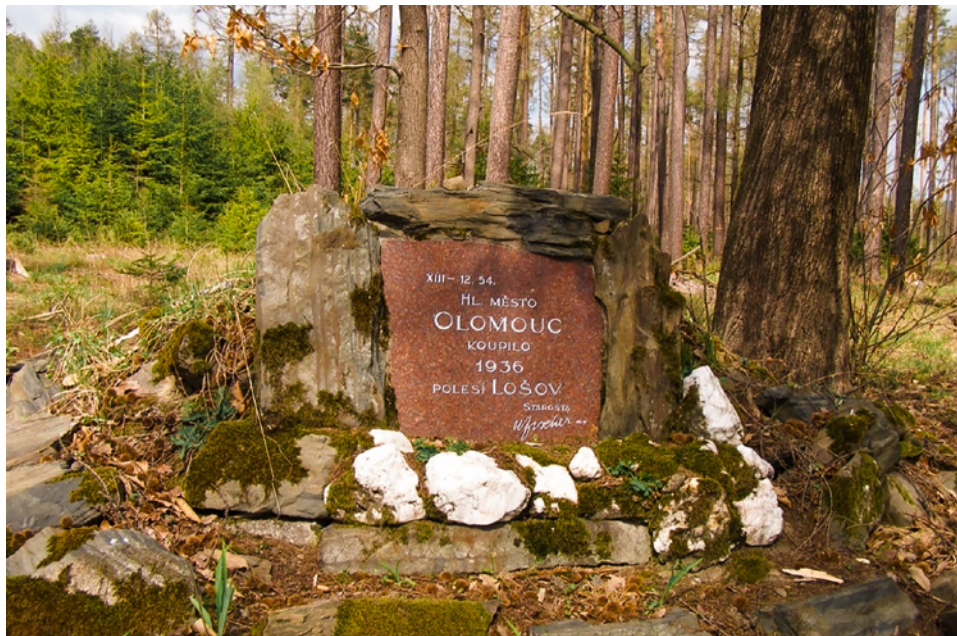
» Město Olomouc na památku odkupu lesů zřídilo kamennou mohylu s žulovou památní deskou.