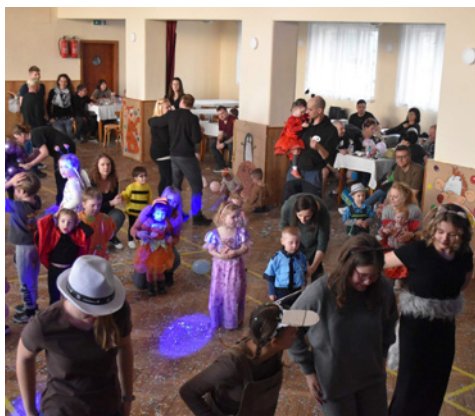
Karneval Lošov. 22. 3. 2025