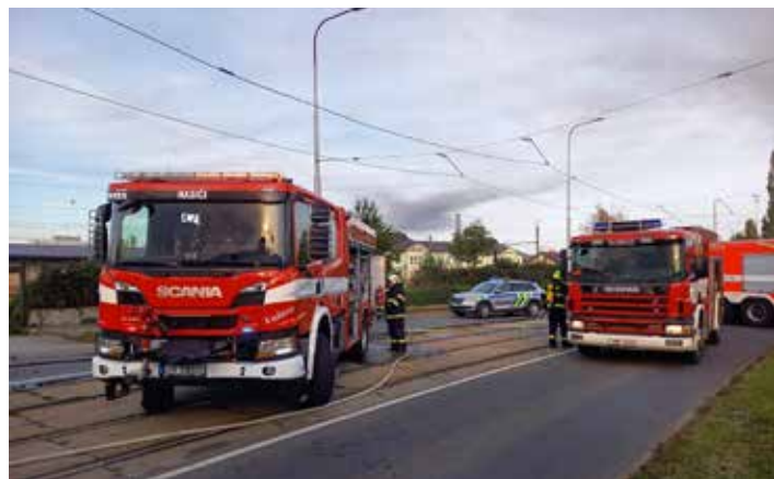
Požární cisterna Scania v akci