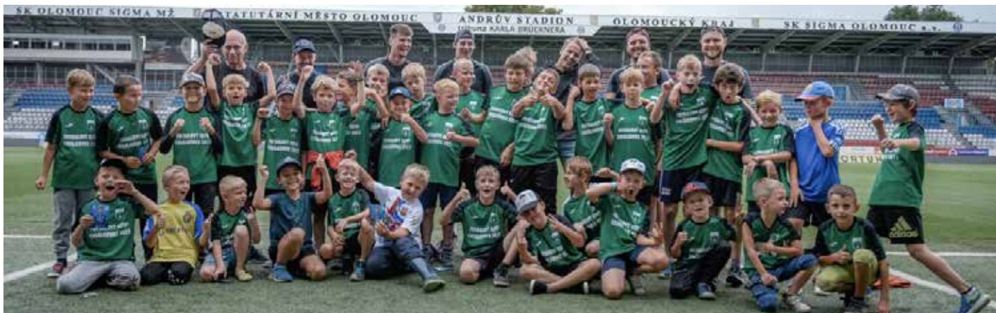
Fotbalový kemp, všechny fotografie použity se svolením M. Ponižila.

Letos slaví SK Chvátkovice 100 let od založení.