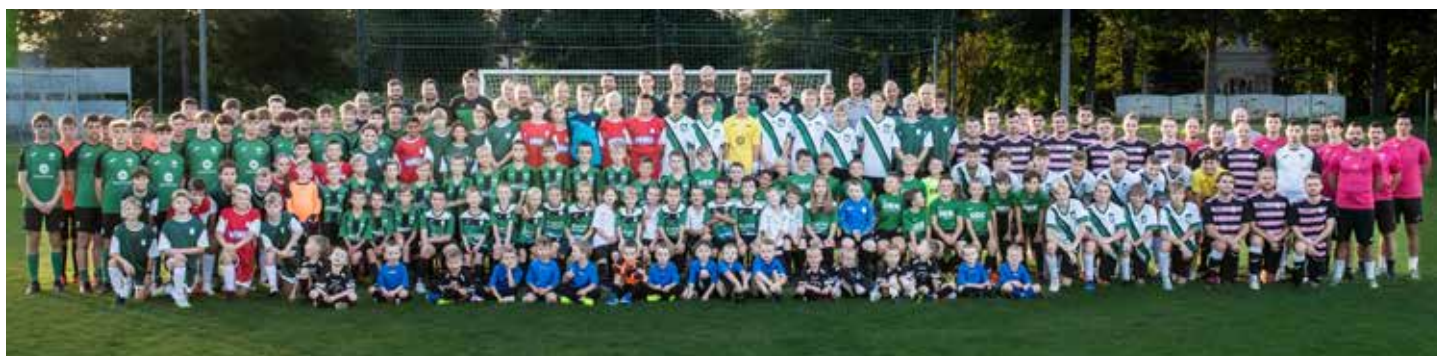
Členové SK Chvátkovice, všechny fotografie použity se svolením M. Ponižila.