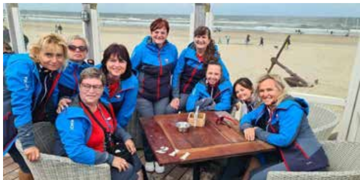
Výlet k moři

Závěrem můžeme jenom říct, že to byl super zážitek, který všem doporučujeme. Třeba zrovna v Lisabonu v roce 2027, kam pořadatelé předali pomyslnou štafetu a kde se uskuteční 18. Světová gymnastařada můžete být i vy. Zájemce o pohyb a hromadná vystoupení zveme mezi nás.