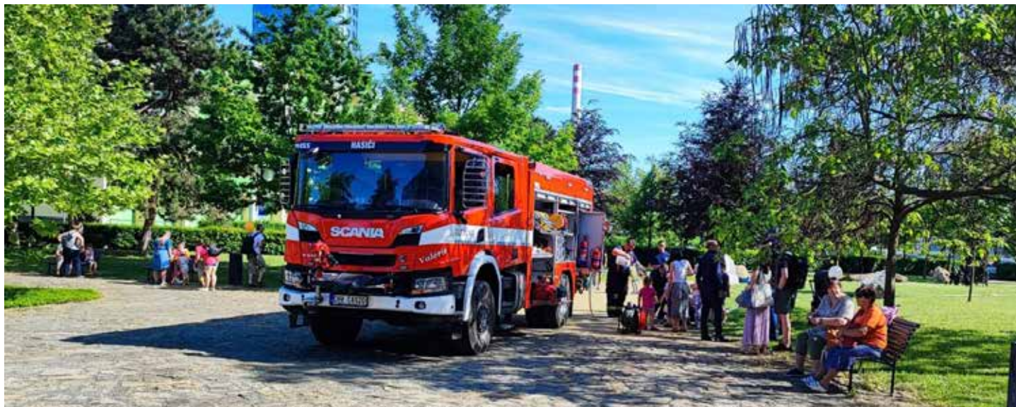
Požární cisterna Scania od firmy Wiss czech

Konečně jsme se dočkali a celý rok 2023 jsme mohli pracovat tak jako v letech před pandemií. V lednu jsme uspořádali VVH, s některými našimi členy jsme se viděli po dlouhých třech letech. V únoru jsme v prostorách místní sokolovny uspořádali tradiční ples. Ten se nám opět vydařil na jedničku. V červnu pořádáme tradiční pohárovou soutěž BHE pro dospělé. Po tříleté vynucené pauze znovu rozjíždíme Memoriál Bernarda Šafaříka st. A to požár-