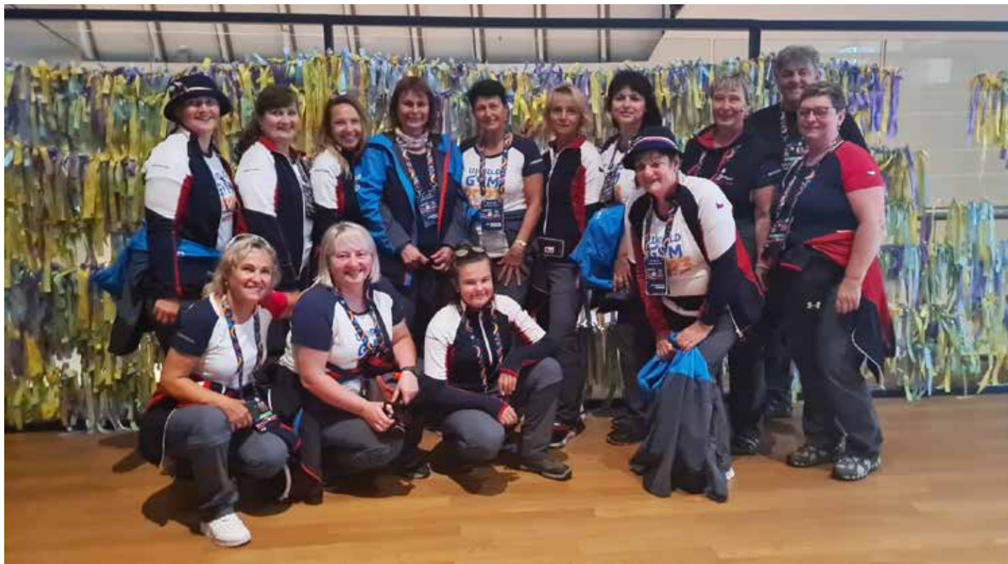
Muzeum van Gogha – pentle se vzkazy (Chválkovice, Nemilany, Nové Sady, Troubelice)

Ve dnech 30. července až 5. srpna 2023 se stal Amsterdam místem konání 17. Světové gymnestrády, což je celosvětová nesoutěžní akce, která se koná každé čtyři roky v různých částech světa.