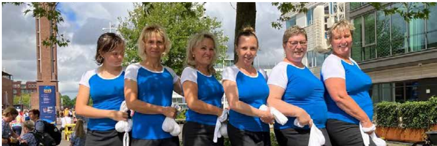
Vlevo část Olympijského stadionu, v popředí cvičenky Rockové symfonie, z Chválkovic a Velké Bystrice