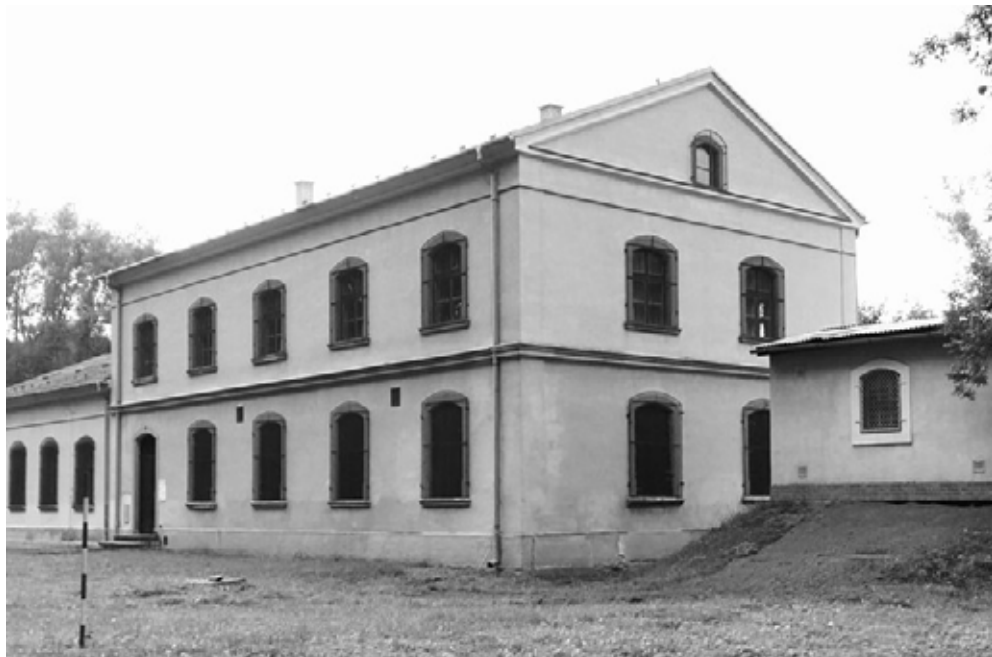
Technický unikát ukrytý v nenápadné budově, rk

Vyřazena z provozu byla vodárna v květnu roku 1960. Nutno ale podotknout, že pramen se dodnes využívá. Čerpání od té doby obstarává elektřina prostřednictvím horizontálních ponorných čerpadel. Oprášit zašlou slávu vodárny se podařilo v roce 1999, když vodárna slavila 110. výročí od svého otevření. Unikátní parní soustrojí pak málem skončilo ve šrotu. Lehce odmontovatelné části, případně některé součástky z drahých kovů se tam odvezly, na zbytek ale našťásti už nedošlo, a to jen náhodou. Přitom každý díl je originál, tenkrát se totiž ještě nevyráběly sériově zaměnitelné kusy. Například na první pohled podobné matky se liší velikostí a jsou na ně potřeba různé klíče.