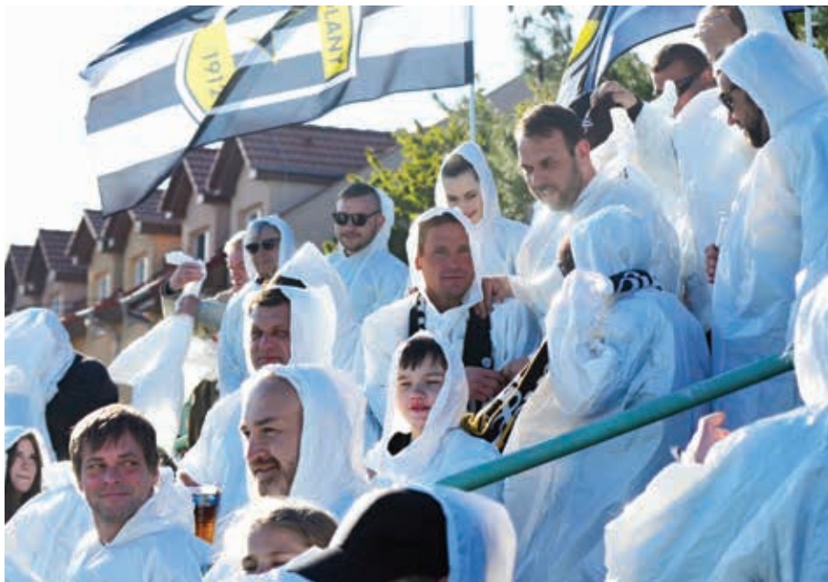
Část fanoušků Hodolan při derby s Černovírem.